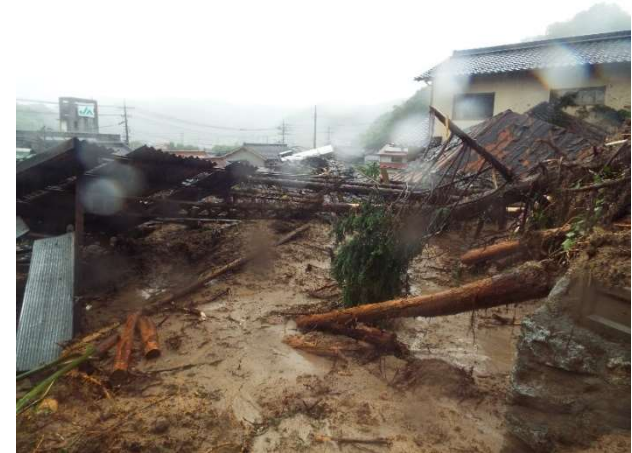
土石流で埋まった家屋