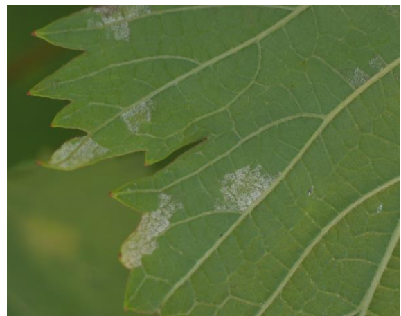
図2 葉裏のべと病菌（白いカビ）