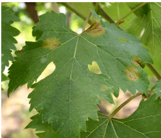
図1 ‘ピオーネ’の葉表の症状