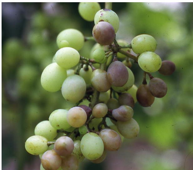
図4 幼果（大豆大期）の症状