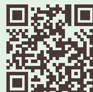
「岡山県共通予約システム」 二次元コード