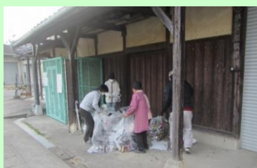
クリーン作戦、美化活動