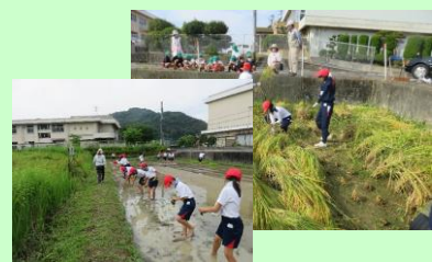
学習田（遊休農地の有効活用）