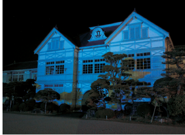
旧遷喬尋常小学校(真庭市)