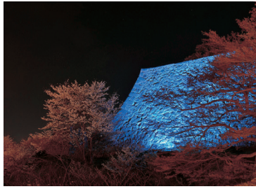
鶴山公園北側城壁(津山市)