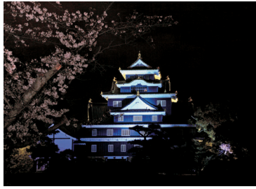
岡山城天守閣(岡山市)