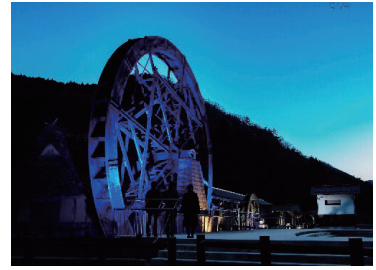
夢さき公園親子孫水車(新見市)