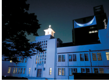
ノートルダム清心女子大学(岡山市)