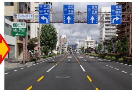
設置後のイメージ