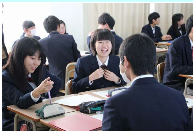
振り返りと見通しを持ったホームルーム活動