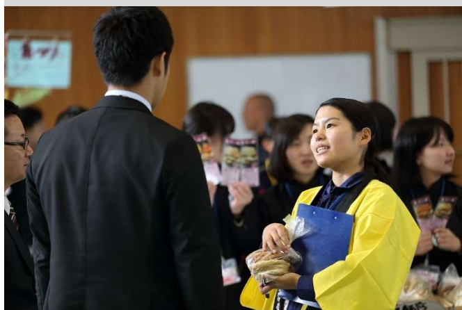
大規模販売実習での丁寧な案内