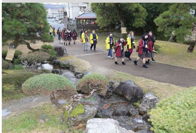
津山の名所を留学生に案内

生徒に身に付けさせたい資質・能力を8つに整理し、販売実習「津商モール」に向けた教育活動を評価・改善する取組を行っている。また、特別活動と各教科・科目を横断した取組や、3年間を見通した体系的な取組を、振り返りと見通しを持ったホームルーム活動や進路ノート(キャリア・ノート)の活用などを通してキャリア教育を推進している。