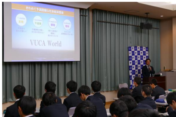
全てのプログラムで外部の専門家による講演を取り入れています。ここで得られる最新の知見は、さまざまな学びに活かされます。

さらに3年生のスタート時、学びの計画書をもとに自らのキャリアデザインを担当にプレゼンテーションすることで、夢の実現に向けて強い意志が生まれます。