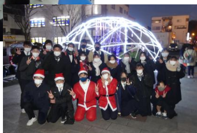
(上)地域学の発表会は、笠岡市長も参加されます。 (下)駅前イルミネーション点灯式の様子。