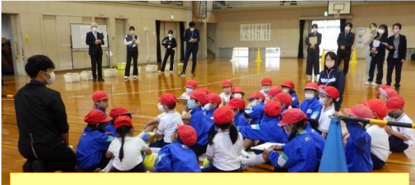
第1学年 ボール投げゲーム