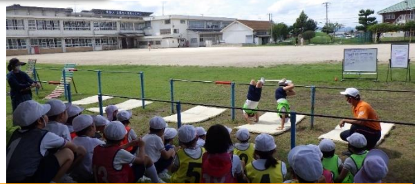
第2学年 鉄棒を使った運動遊び