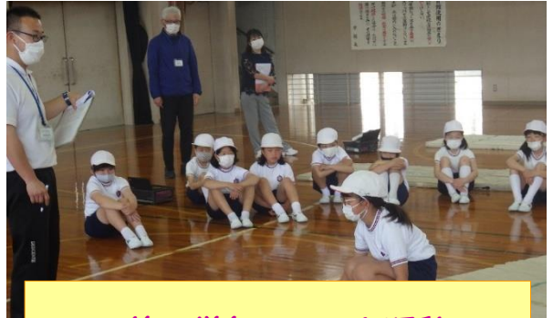
第4学年 マット運動