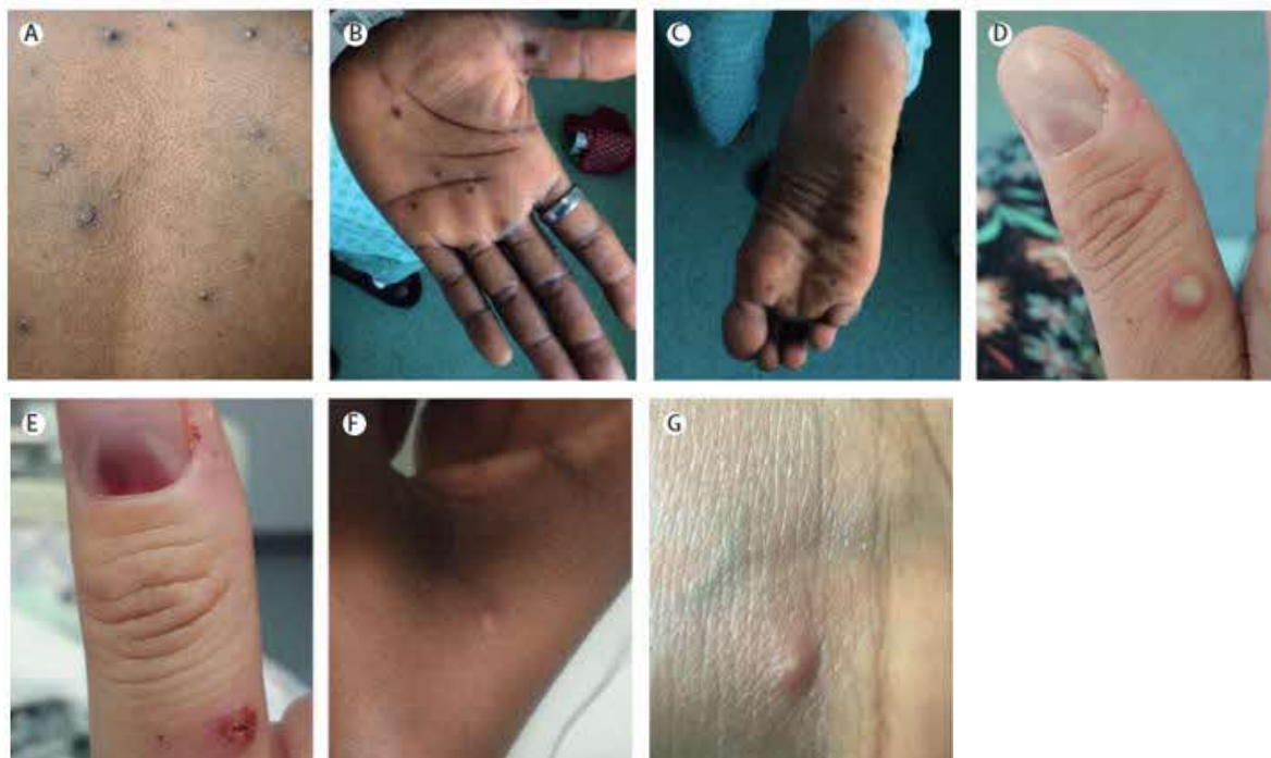
A : 小水疱、B, C : 手掌、足底の斑点状の皮疹、D : 膿疱と爪下病変、E : 爪下病変、F, G : 小丘疹、小水疱 (文献 1)

顔面 (95%)、手掌、足底 (75%) に好発する。発疹の経過は 10 日程度で、斑点状→小水疱→膿疱→痂皮と経過をたどる。発疹が多く発生する部位として、多い順に、顔 > 脚 > 体幹 > 腕 > 手掌 > 生殖器 > 足底が挙げられる 1 。口腔粘膜や結膜、角膜にも発症した例が報告されている。痂皮は 3 週間は完全に消失しないことがあり、結痂 (けつか) が乾燥して痂皮になり、剥がれ落ちると感染力はなくなる 2 。