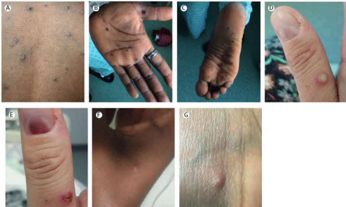
(文献 1) サル痘と鑑別が必要な発疹性疾患 (文献 3 Table1 をもとに感染研で訳)

A：小水疱、B,C：手掌、足底の斑点状の皮疹、D：膿疱と爪下病変、E：爪下病変、F,G：小丘疹、小水疱