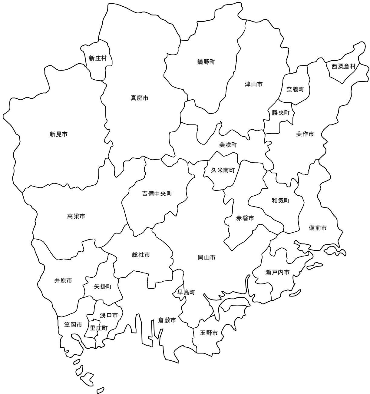
人口と世帯数