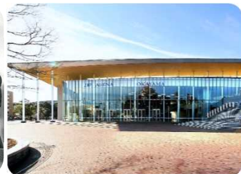
ジップアリーナ岡山