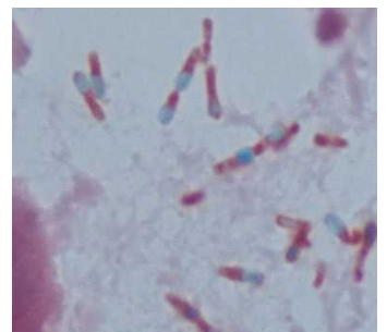
図 1 組織標本芽胞染色像

スタンプ標本では、グラム陽性の大桿菌が確認され、芽胞染色像により、偏在性に芽胞を有することが確認された。HE 染色像では、筋線維間に膠原線維の増生や空胞、および好中球の浸潤や出血が見られ、筋線維の断裂、核や横紋の消失も確認された。筋線維間には、多くの大桿菌が確認され、グラム染色像および芽胞染色像により、芽胞を有するグラム陽性菌であることが確認された (図 1)。