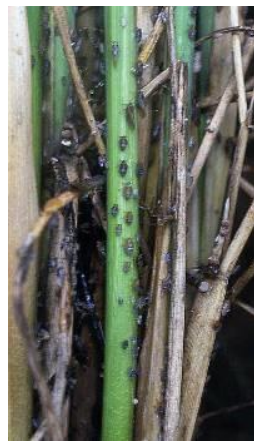
株元に集中して生息