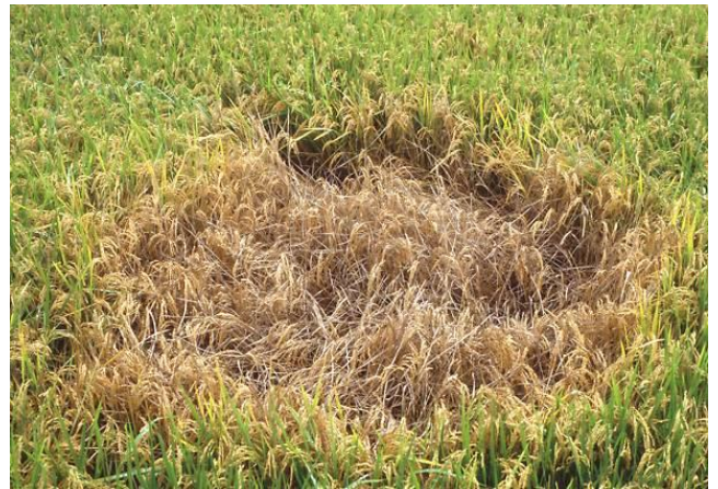
圃場の被害（坪枯れ）