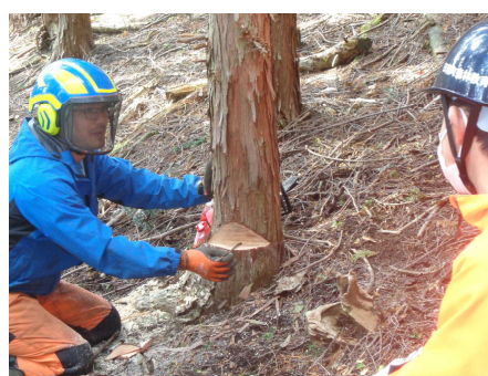
にちなん中国山地林業アカデミー視察