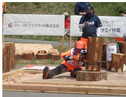
全国大会（青森大会）