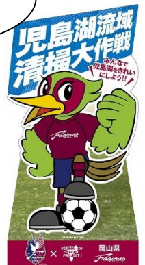
特大コラボパネル