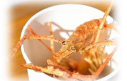
テナガエビ唐揚げ（イメージ）