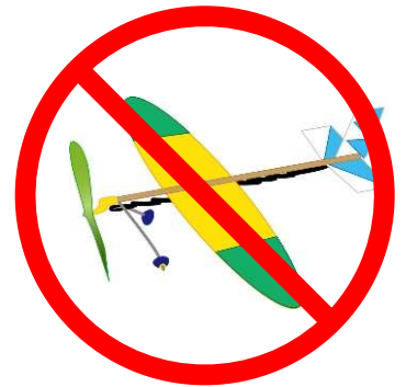
模型航空機の飛行 (ゴム動力機など)