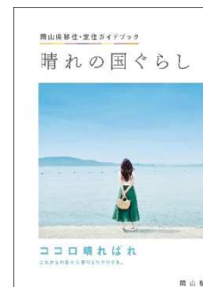
< 冊子版（前後両表紙） >