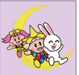
岡山県マスコット「ももっち・うらっち」