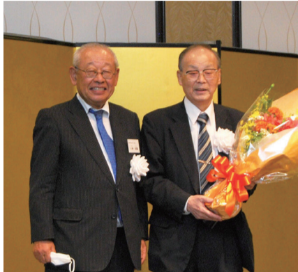
小林新会長(左)と河合新相談役(右)