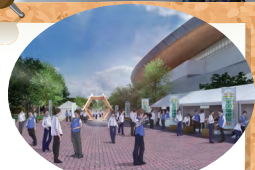
展示PR会場 「FECO&MOK ハレびろば」イメージ

環境・森林・林業・木材関連の製品・技術・取組などを紹介する展示PR会場もあります!