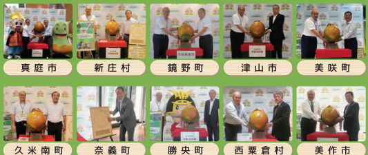
真庭市 新庄村 鏡野町 津江市 美咲町 久米南町 奈義町 勝央町 西粟倉村 美作市