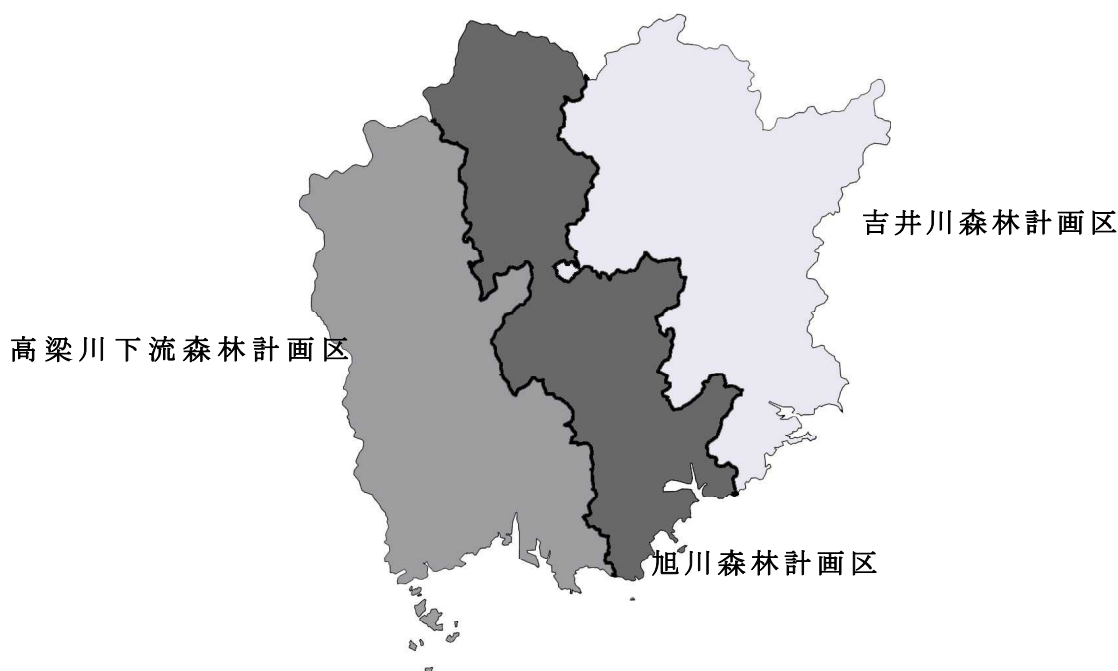
岡山県森林計画区位置図