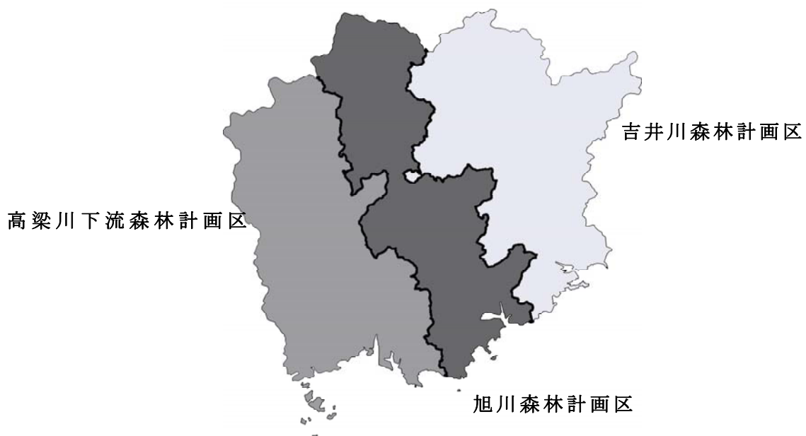
岡山県森林計画区位置図