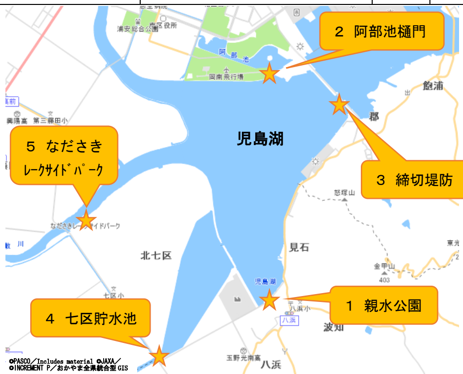
図1 調査場所位置図