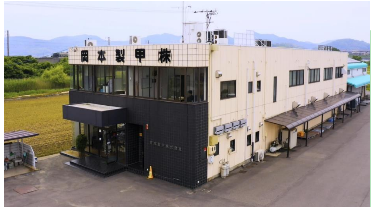
倉敷市茶屋町 本社工場