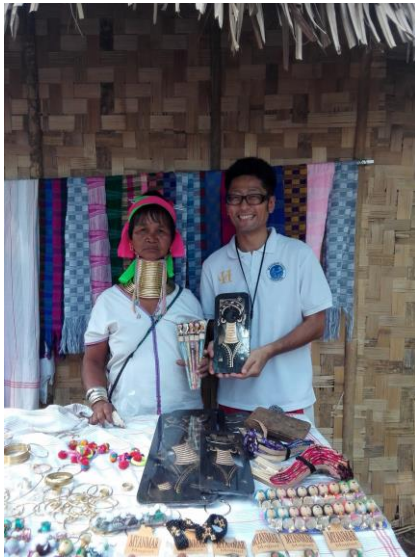
ミャンマー民族文化祭り