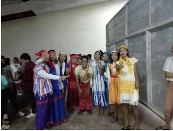
朝日小学校スカイプ交流