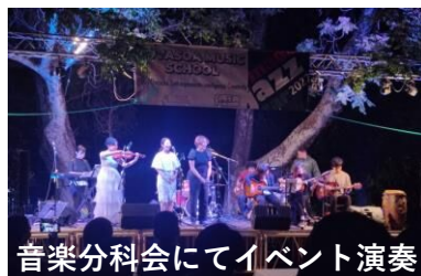
音楽分科会にてイベント演奏