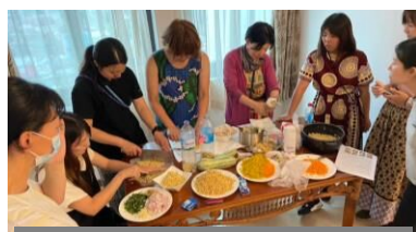
料理分科会にてレシピの試作