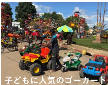
子どもに人気のゴーカート