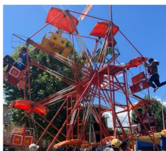
お兄さん(右上)が ぶら下がって動かしてます