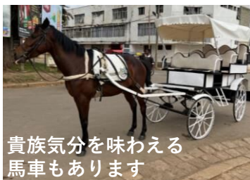
貴族気分を味わえる 馬車もあります