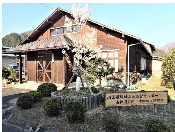
【木材加工研修棟】 真庭市勝山