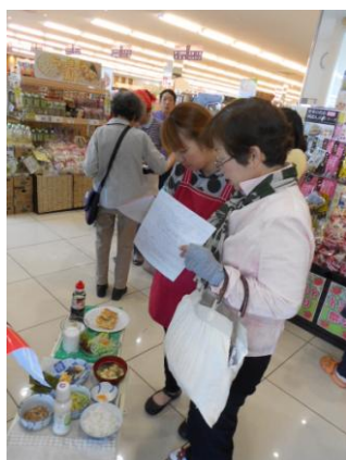
※朝食見本見ながら 聞き取り調査