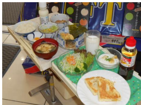
※バランスの取れた和食、洋食の 朝食見本を展示