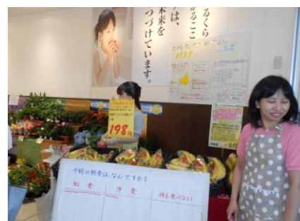
※バナナの特徴をポスターで告知