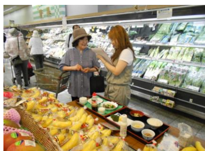
※バナナの試食も好評