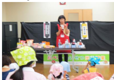
② 栄養士さんの講話