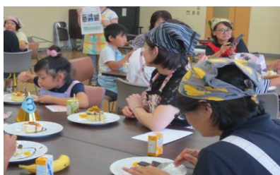
⑤ みんなで楽しく交流