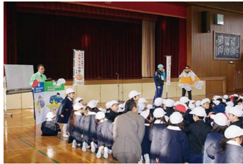
浅口市立金光小学校での防犯教室実施状況

この写真は、平成21年1月9日(金)「犯罪ゼロの日」に合わせて行った浅口市立金光小学校での防犯教室の様子です。