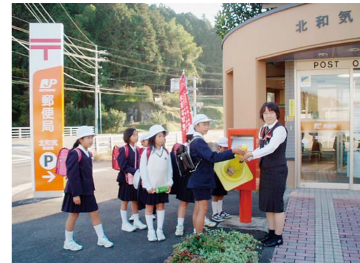
北和気郵便局の取組