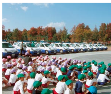
岡山市立伊島幼稚園の皆さんも出発式に参加

県内全域で活躍中の警察スクールサポーターとスクールガードリーダーが活動用車両「ももっぴー」により、通学路等におけるきめ細かな目配り、気配りを実践しています。