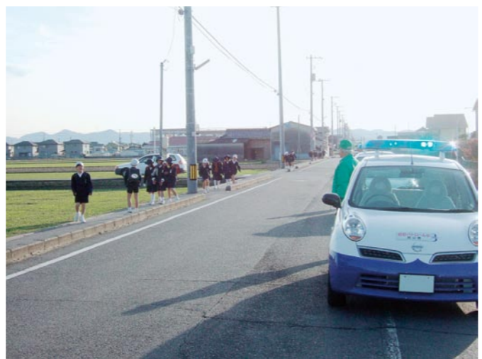
岡山市立第二藤田小学校区での見守り活動実施状況