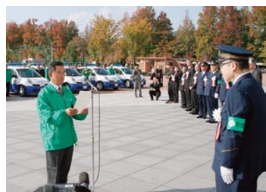
警察スクールサポーター代表者による決意表明

県内全域で活躍中の警察スクールサポーターとスクールガードリーダーが活動用車両「ももっぴー」により、通学路等におけるきめ細かな目配り、気配りを実践しています。