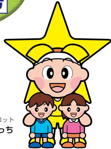
岡山県マスコット ももっち