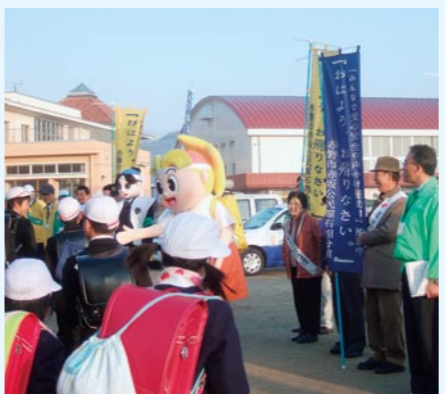
「おはよう、おかえり」県民運動実践中

※実践事例 「赤磐市立石相小学校」(20年12月) ~明るいあいさつで、地域の絆が深まっています~