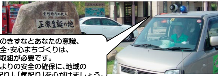
小田防犯パトロールの会の活動状況

安全は 地域のきずなとあなたの意識、 犯罪のない安全・安心まちづくりは、 地域ぐるみの取組が必要です。 子どもやお年よりの安全の確保に、地域の みんなで「目配り」、「気配り」を心がけましょう。