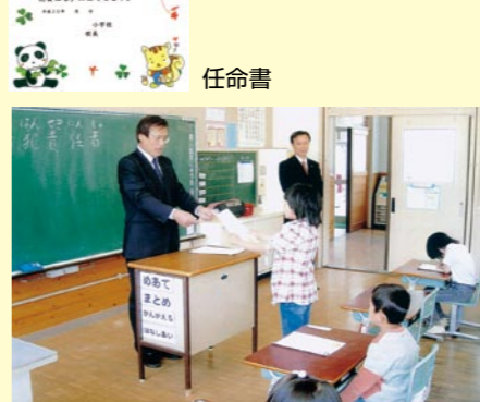
小学校での任命書交付状況

※実践事例 「わたしの家の防犯責任者」 (真庭市内) 子どもたちも家族にかぎ掛けを呼び掛けています。