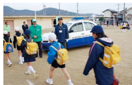
浅口市立金光小学校での「おはよう、おかえり」県民運動実施状況