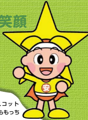
岡山県マスコット ももっち