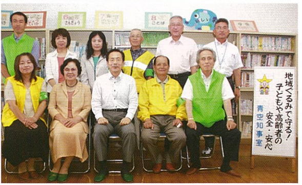
石井知事と意見交換会参加者