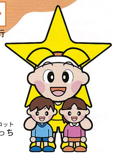
岡山県マスコット ももち