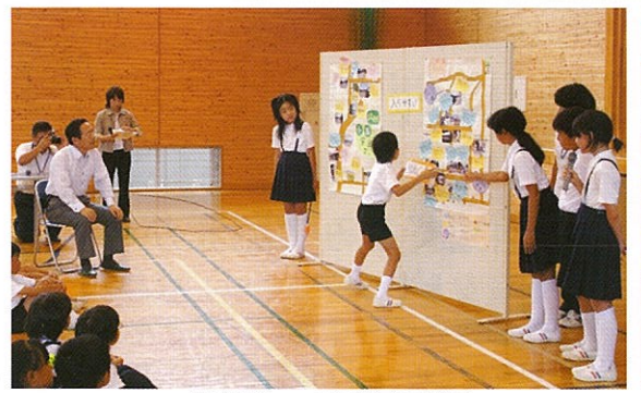
地域安全マップの発表の様子

青空知事室が矢掛町立小田小学校で開催され、はじめに小田小学校5年生児童による地域安全マップの作製発表が行われました。その後、図書室で「地域ぐるみで守る! 子どもや高齢者の安全・安心」をテーマに意見交換が行われました。