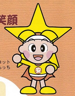
岡山県マスコット ももち

参加者の声 「『入りやすい』、『見えにくい』という視点で、日常生活では気が付かない危険箇所を見極める力を学びました。ぜひ、地域で子どもたちに伝える場をつくりたいと思います。」