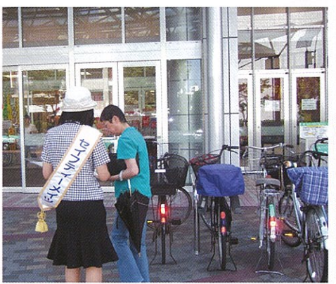
街頭キャンペーン

平成21年6月12日(金)「犯罪ゼロの日」一周年記念行事として、イトーヨーカドー岡山店北側エリア(ジョイボリス前)での街頭キャンペーン山陽新聞本社1階「さん太広場」で警察音楽隊によるミニコンサートを行いました。