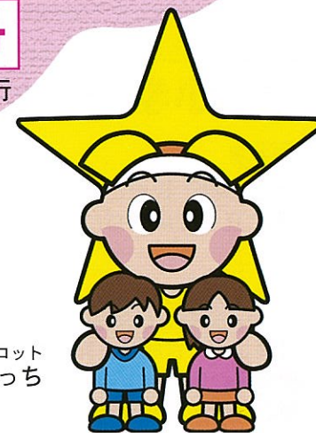
岡山県マスコット ももち