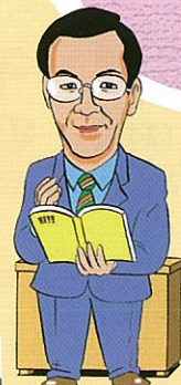
[小宮 信夫 教授]