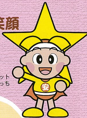
岡山県マスコット ももち