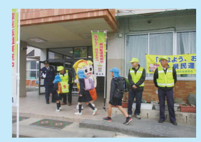
勝田小学校(美作市)

10月10日(火)に瀬戸内市立国府小学校、11月10日(金)に美作市立勝田小学校で、それぞれ「おはよう、おかえり」県民運動の実践行事を行いました。行事には、地元の教育委員会、警察署のほか、地域の防犯ボランティアの皆さまにもご参加いただき、登校してくる子ども達は、大きな声で元気よくあいさつをしていました。