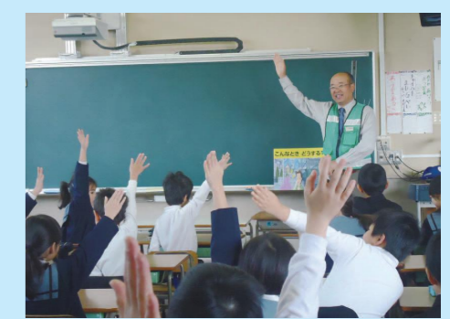
早島小学校(早島町)

11月15日(水)に早島町立早島小学校で、早島交番自主パトロール隊の方によるアサガク防犯教室が行われました。教室では、パトロール隊の方から「知らない人から声をかけられたらどうする？」との質問に、子ども達が積極的に手を挙げて答えるなど、防犯意識の向上が図られるとともに、日ごろからお世話になっている防犯ボランティアの方とのつながりがさらに深まり、大変有意義な学びの時間となりました。