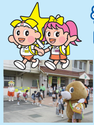
国府小学校(瀬戸内市)

10月10日(火)に瀬戸内市立国府小学校、11月10日(金)に美作市立勝田小学校で、それぞれ「おはよう、おかえり」県民運動の実践行事を行いました。行事には、地元の教育委員会、警察署のほか、地域の防犯ボランティアの皆さまにもご参加いただき、登校してくる子ども達は、大きな声で元気よくあいさつをしていました。