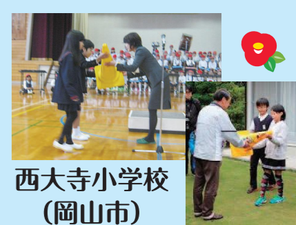
西大寺小学校(岡山市)

県が取り組んでいる「子ども110番の家」支援事業には、JA共済連岡山から物品支援のご協力をいただいております。本年度も、県内約70校の小学校に対し、子ども110番の家の目印となる黄色いセーフティコーン約1,300本を寄贈していただきました。寄贈していただいたコーンは、学校単位で、子ども達自ら、お世話になっている地域の方々へ直接手渡す等の活動も行われています。