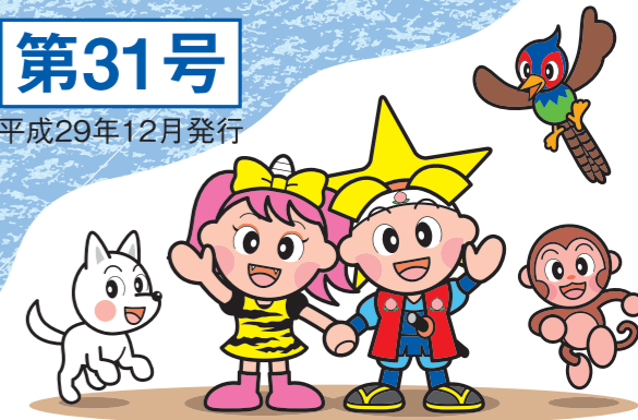
岡山県マスコット 「ももち」・「うらっち」と仲間たち