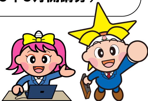
岡山県マスコット うらっち/ももっち

「コースガイドご利用上の注意」 (1ページの目次下)及び2～5 ページをよく読み、内容をご理解 の上、出願してください。