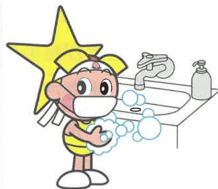
「岡山県マスコット ももち」