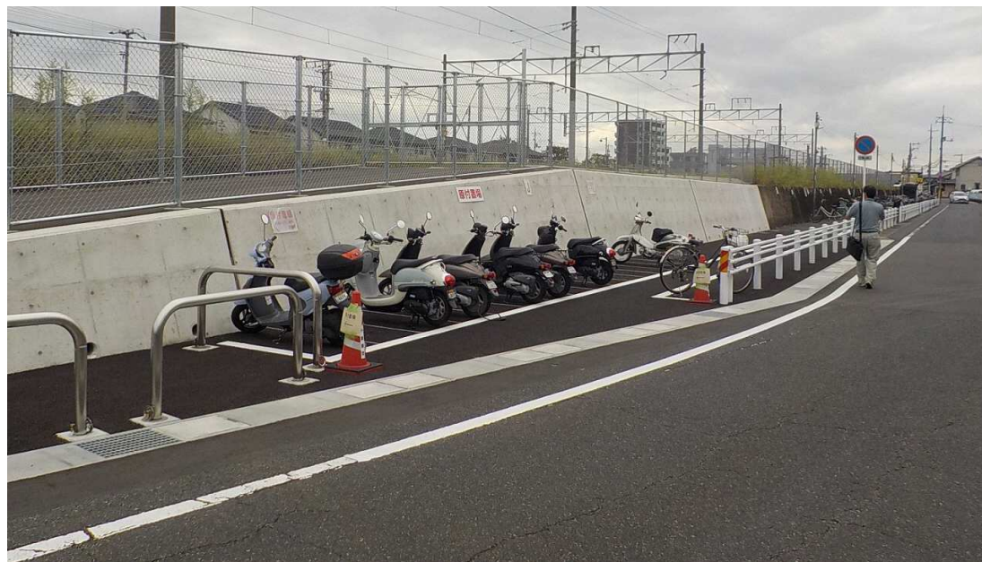
←JR西阿知駅 駐輪場整備