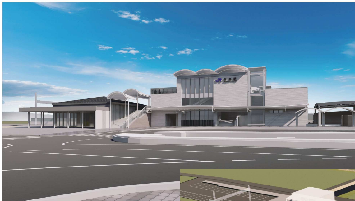
←早島駅周辺拠点整備事業