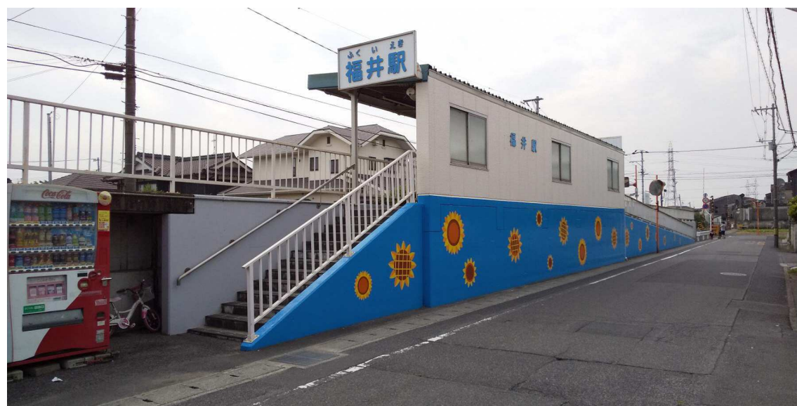
水島臨海鉄道 福井駅の外壁の美装化→