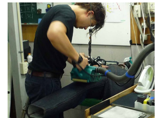
生地にやすりをかけるダメージ加工は、ジーンズをはき慣らした印象に

新品ジーンズに洗い加工を施したのは、実は岡山が初めて。色落ちによるビンテージ感を出すためのダメージ加工をはじめ、職人の感性と技術が結び付いた加工は進化を遂げている。