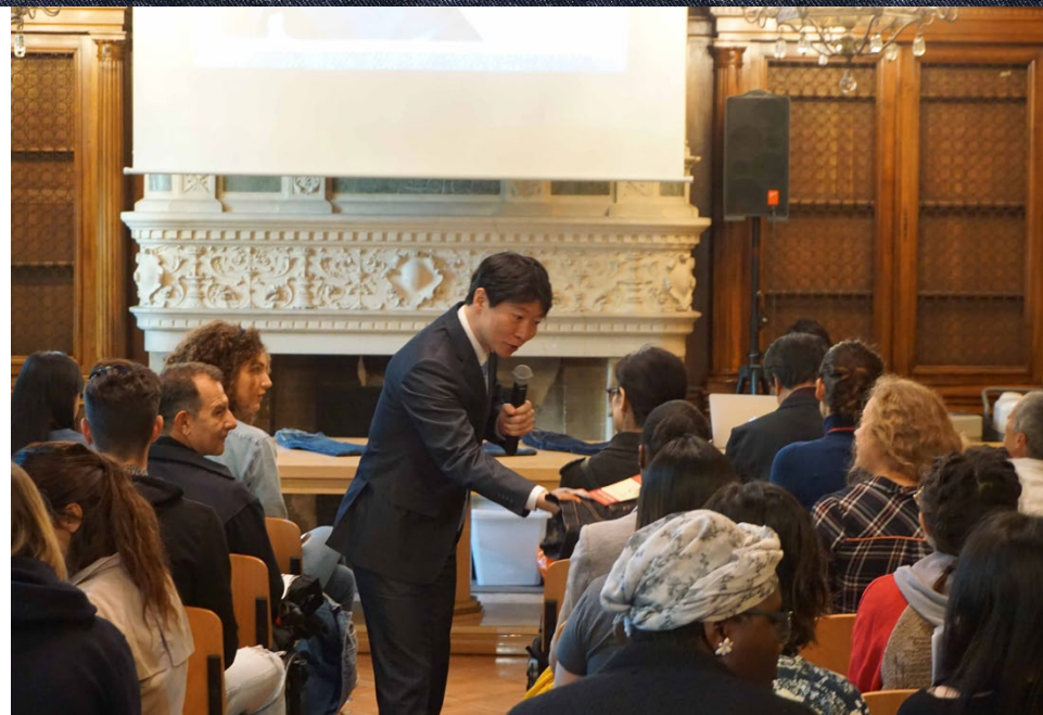
「岡山デニム」の印象、感想を聞く伊原木知事。知事が着用しているのはデニムスーツ!