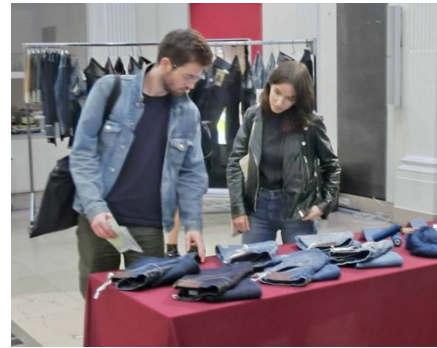
専門学校内では、「岡山デニム」の展示会も。素材、加工技術の違いによる生地表情の違いをじっくり見る人の姿が