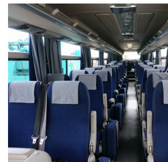
観光に来た人に岡山らしさを感じてもらおうと、バスの座席にデニム生地を使用

家具用生地「倉敷ロータスデニム」は、表面加工をしているのではっ水性があり、色あせにくく上品な光沢が魅力。岡山らしさを表すために、デニム地が公共の場で活用される場面も増えてきています。例えば岡山桃太郎空港や観光バスの座席にも…。訪れたらぜひ見つけてみて。