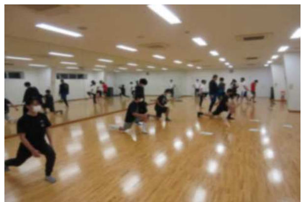
ソフトボール（女子）