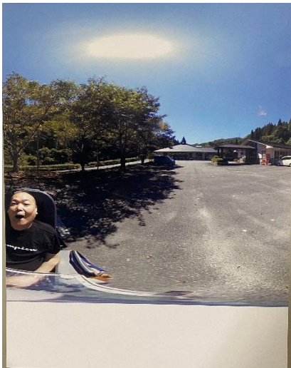
「ひとりの散歩も楽しい」