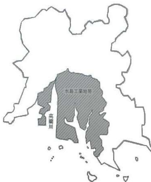
水島工業地帯の区域

水島海岸通1～5丁目、水島川崎通1丁目、水島中通1～4丁目、水島福崎町、水島西通1～2丁目、水島東千鳥町、水島西千鳥町、水島相生町、水島東常盤町、水島西常盤町、水島東栄町、水島西栄町、水島東弥生町、水島西弥生町、水島東寿町、水島西寿町、水島東川町、水島南緑町、水島北緑町、水島南瑞穂町、水島北瑞穂町、水島南春日町、水島北春日町、水島南幸町、水島北幸町、水島青葉町、水島高砂町、神田1～4丁目、水島明神町、水島南亀島町、水島北亀島町、福田町浦田、福田町福田、福田町古新田、北畝1～7丁目、中畝1～10丁目、福田町東塚、東塚1～7丁目、南畝1～7丁目、松江1～4丁目、潮通1～3丁目、福田町広江、広江1～8丁目、呼松町、呼松1～3丁目、連島町連島、連島町亀島新田、連島町西之浦、連島町鶴新田、連島町矢柄、鶴の浦1～3丁目、連島1～5丁目、連島中央1～5丁目、亀島1～2丁目、児島通生、児島塩生、児島宇野津、玉島乙島