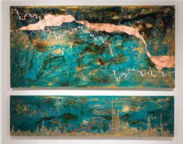
上〈As long as the wind blows〉2021 下〈How I learned to stop worrying and love the bomb〉2018