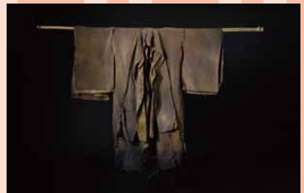
上〈渡し舟〉(部分) 2022 下〈回帰〉2022