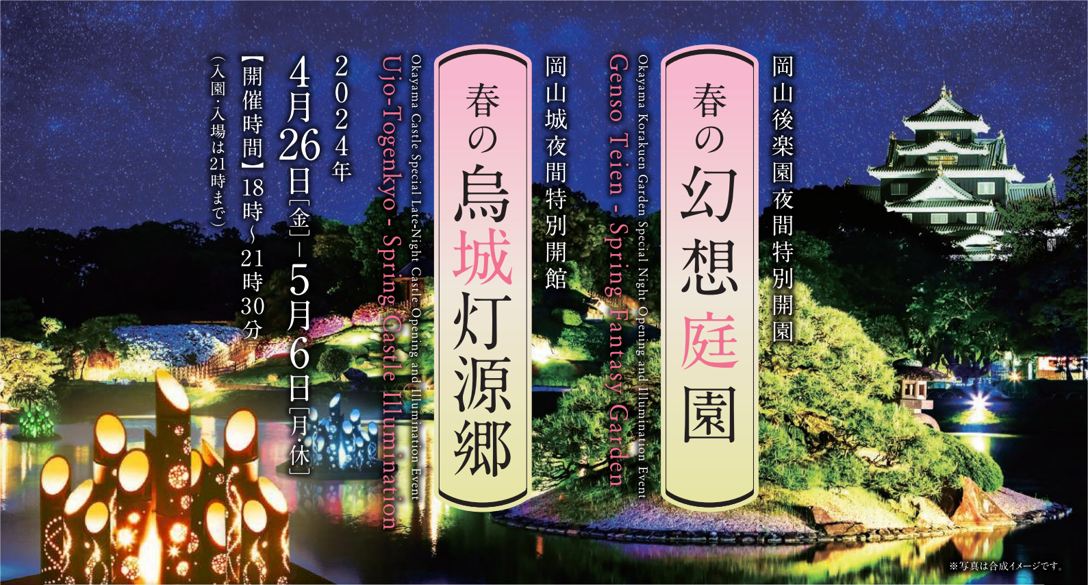
※写真は合成イメージです。