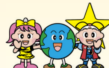
岡山県マスコット「ももっち」と「うらっち」