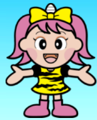
岡山県マスコット「うらっち」