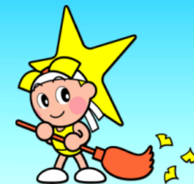
岡山県マスコット「ももっち」

「岡山県産業廃棄物処理税」は、循環型社会の構築を推進するため、3つの使途を柱として各種の事業に活用しています。