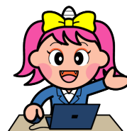
岡山県マスコット「うらっち」