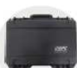
防水プロボケース