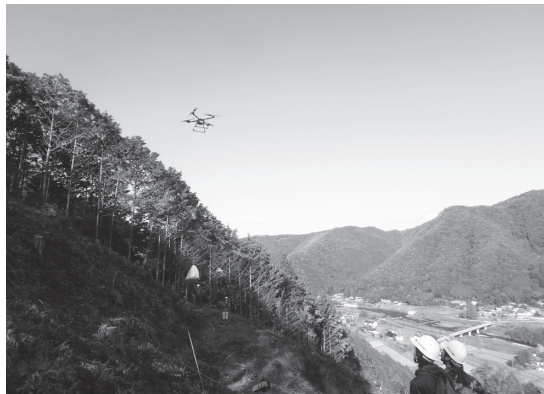
コンテナ苗の運搬(着陸)

搬するのに26回のフライトを要し、積み込み荷下ろしの作業時間は1時間54分、飛行時間は1時間10分で、合わせて約3時間かかりました。 峰越しによるコンテナ苗の搬入であったことから操縦者からの視野だけでなく、無線機を使用しながら受け取り側と調整を行いました。