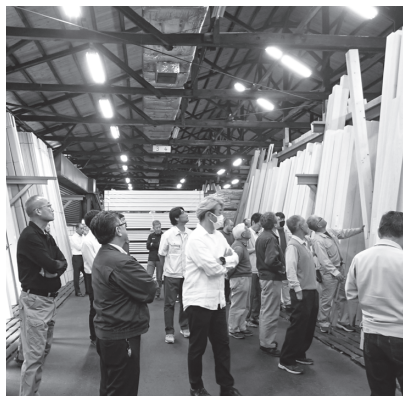
5月15日のさつき特市

60人を超える従業員がいた頃は、そろばんや電卓で計算していたため、市の締めが翌朝までかかるほどの繁忙を極めたそうです。