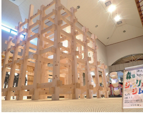
入口正面に設置された森のジャングルジム

温泉施設に木製玩具を設置し、お子様連れの来館者に安心してくつろいでいただくとともに、木のぬくもりにふれあうことで「木