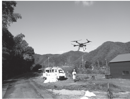
コンテナ苗の運搬(離陸)

ました。また、苗木の活着も良好であったことから、今回、令和5年度おかやま元気な森づくり推進事業により、ドローンを活用したコンテナ苗の運搬を実施しました。