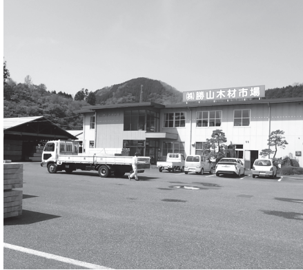
(株)勝山木材市場 通称 カツイチ

真庭地方で生産された製品が都市圏、岡山で売られていた当時、生産地での共同販売を志して昭和28年に創立されました。