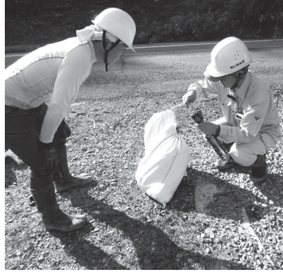
コンテナ苗の袋つめを行う

昨年度、岡山普及指導区内の造林地において岡山森林組合が岡山県森林組合連合会で所有している資材運搬用ドローンを用いて少花粉ヒノキの植栽を行いましたので、その状況を報告します。