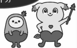
森林保険公式キャラクター そよりん たもちい

編集 岡山県森林組合連合会内 発行 岡山県森林改良普及協会 〒701-1202 岡山市北区檜津四九一―一