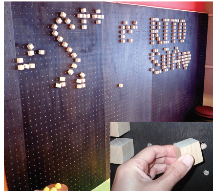
ウッドブロックサインボード

また、施設内には、東京2020五輪の選手村で使用した県産材を再利用したプレイハウスも設置されています。 どうぞくつろぎにおいでください。 （新見普及指導区 渡邊 康太郎）