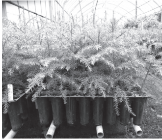
【少花粉スギコンテナ苗】

本格的な利用期を迎えたスギ・ヒノキ人工林の主伐及び再造林を進めるとともに、国民の約4割以上を苦しめている花粉症の対策を行うため、少花粉かつ植栽時期を選ばないコンテナ苗を使用した一貫作業による再造林を推進します。