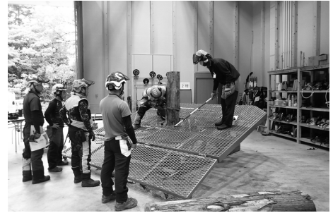
伐採技術向上研修(R5)

岡山県農林水産総合センター森林研究所（普及連携部普及推進課 林業普及推進班）及び県から委託を受けた（公財）岡山県林業振興基金において、森林施業を担う林業従事者や市町村職員等を対象とした研修を今年度も引き続き実施します。