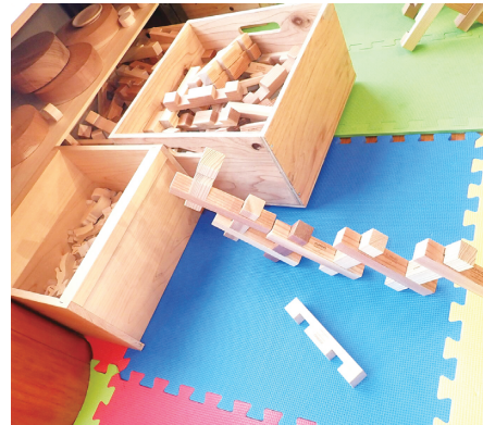
木育ブースの木製玩具