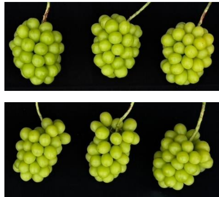
図2 果房の外観 (上：管理あり、下：管理なし)